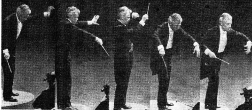
Herbert von Karajan dirijind

prilejul publicării unei scrisori adresate de șeful de orchestră vienez lui Marcel Landowski, de porecla care îl numește un fel de ministru de comerț al dirijorilor de azi. Atâtea contracte, înțelegeri, dispoziții, cu puncte și subpuncte și post-scriptum ne-au îngrozit, și atunci am căutat o imprimare făcută de marele muzician sau ne-am amintit de toate concertele despre care am citit, și ne-am întrebat de ce se face mai multă publicitate omului de afaceri sau „consilierului” Karajan (fiindcă director pe viață este la Filarmonia din Berlinul occidental) decât artei lui excepționale. Știm mai bine câte iubite, avioane, automobile de comandă specială, contracte, avocați etc., are Karajan decât numărul concertelor și al imprimărilor sale. O revistă de cultură din Franța s-a ocupat recent într-o pagină întreagă de plecarea lui din funcția administrativă pe care o ocupa la Paris, în timp ce cu câteva pagini mai încolo publica o cronică de 12 (douăsprezece) rinduri la unu din discurile sale.