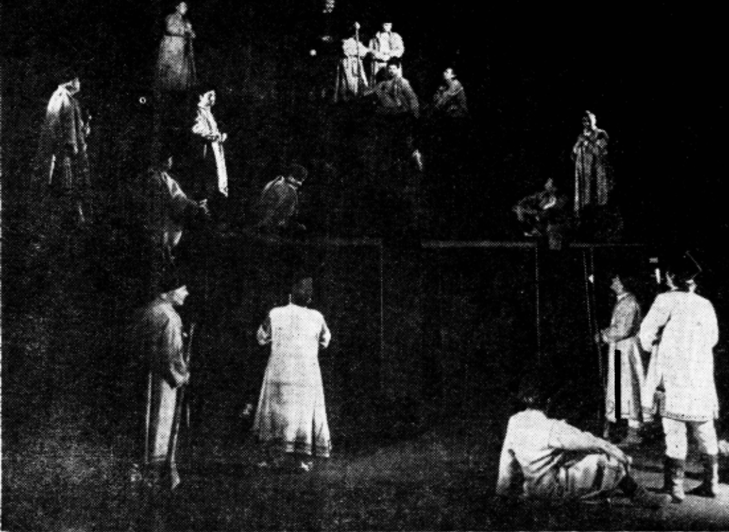
„Zodia taurului“ de Mihnea Gheorghiu, Teatrul Național din Craiova. Regia. Vlad Mugur ; scenografia, Florica Mălureanu.

colo ne revin sporite obligații, celor ce lucrăm în științele sociale, tuturor oamenilor de cultură legați de realitățile poporului român, de a elabora noi lucrări teoretice care să dezvolte tezele de bază ale politicii și ideologiei marxist-leniniste ale partidului nostru, pentru a înlesni aprofundarea lor de către toți oamenii muncii.