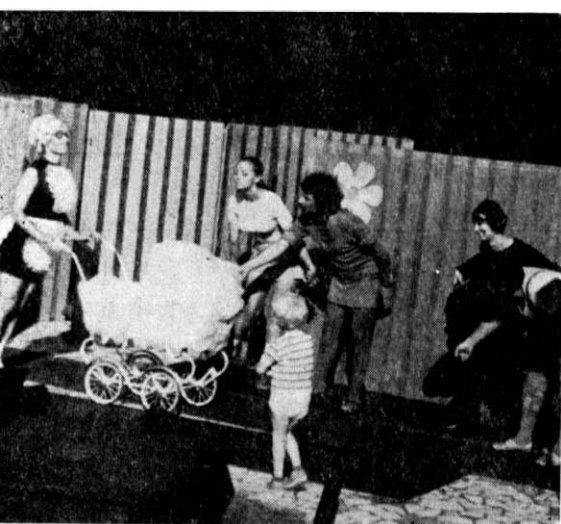
Mangalia, barul Calypso: „Baby-bar” — un spectacol pentru copii (dar nu în exclusivitate)

— Dintre spectacolele care au avut un ecou mai larg în opinia teatrală, câte au fost reprezentate în turneu pe Valea Prahovei?