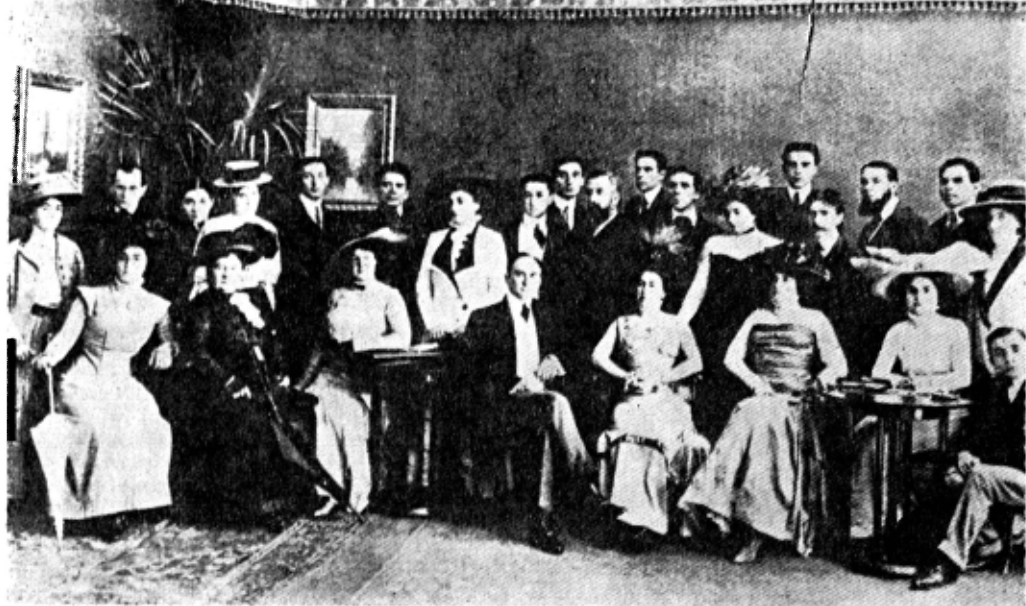
„Compania Dramatică Davila“ (1910), în formația ei de turneu la Constanța