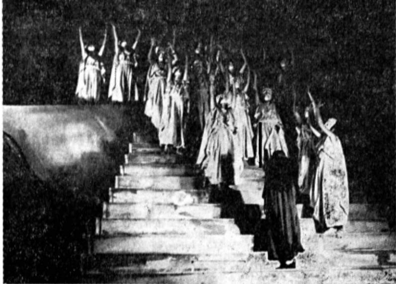
„Ifigenia în Taurida“ în interpretarea Teatrului de Dramă și Comedie din Constanța