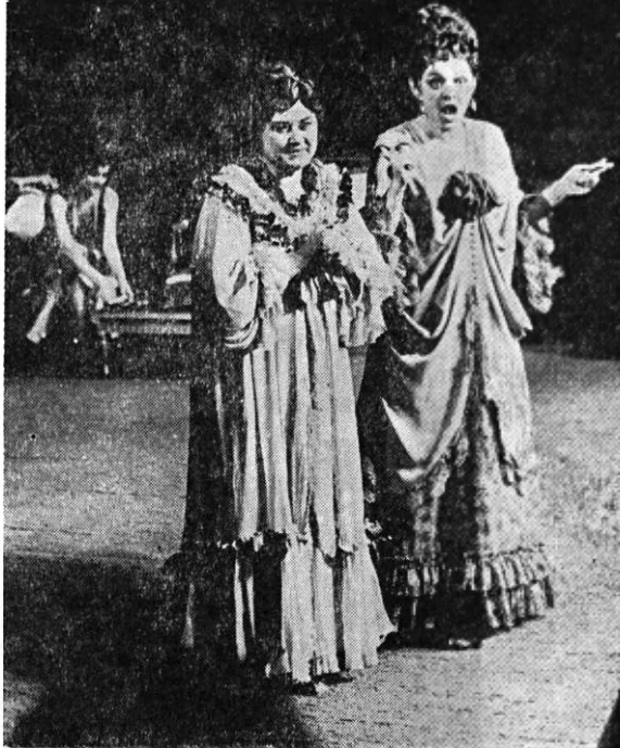
Tamara Buciuceanu-Botez (Chiriachița), Ileana Stana Ionescu (Dacia) și, în plan secund, Mariella Petrescu (Sarmisegetuza).