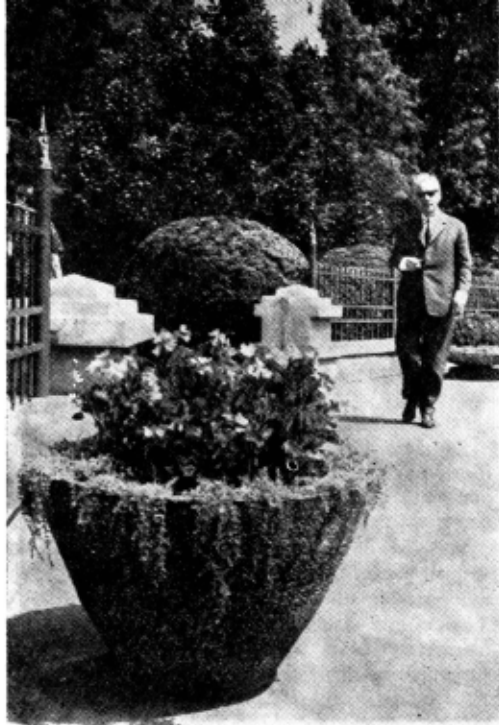
AL. VOITIN: Îmi recitesc piesele ne jucate