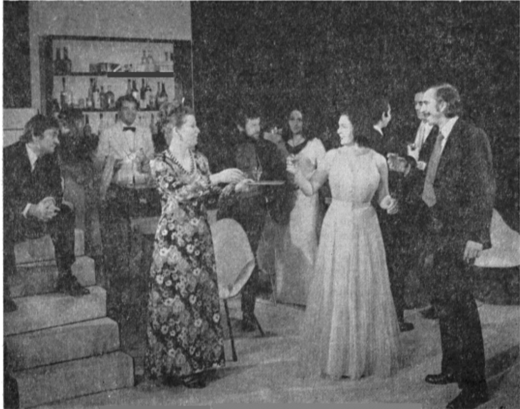
Sîmbătă la Veritas de M. R. Iacoban la Teatrul Giulești : omogenitate stilistică în compoziții expresive (Mențiune).

fața teatrului nostru, ca și animatorului său artistic, polyvalentul om de teatru, Lăviu Ciulei. Fierească este și distincția premială acordată amplei montări de pe marea scenă a Naționalului Bucureștean, Un fluture pe lampă , de Paul Everac, realizată în regia lui Horea Popescu, în toamna anului 1972, montare care transmite sălii cu limpezime și culoare, mesajul de actualitate al piesei.