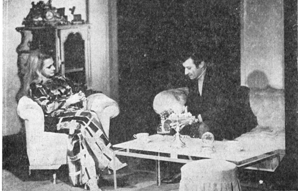
Un fluture pe lampă de Paul Everac la Teatrul Național „I. L. Caragiale” transmite sălii cu limpezime și culoare mesajul de actualitate al piesei (Premiul II)