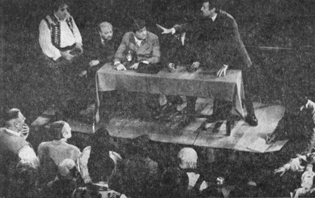
Puterea și Adevărul de Titus Popovici, Teatrul „Lucia Sturdza Bulandra” : reprezentație exemplară pentru condiția spectacolului politic (Premiul I)