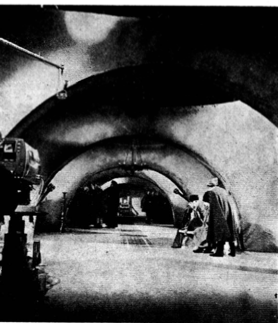
Pe platou, în timpul transmisiei spectacolului cu piesa „Vlaicu Vodă” de A. Davila. Regia, Petre Sava Băleanu ; scenografia, Teodora Dinulescu

televiziune al doilea spectacol de după premieră cu Răzbușnarea suflerului . După două stagii, acest spectacol se menține și acum în repertoriul teatrului, cu același succes de public. La fel, Prețul . Spectacolul Teatrului Mic, televizat după ce realizase în teatru peste 100 de spectacole timp de trei stagii, înaintea prezentării pe micul ecran nu mai făcea săli pline. Ulterior, a început să fie din ce în ce mai solicitat de publicul care-și motiva interesul prin vizionarea spectacolului la televizor.