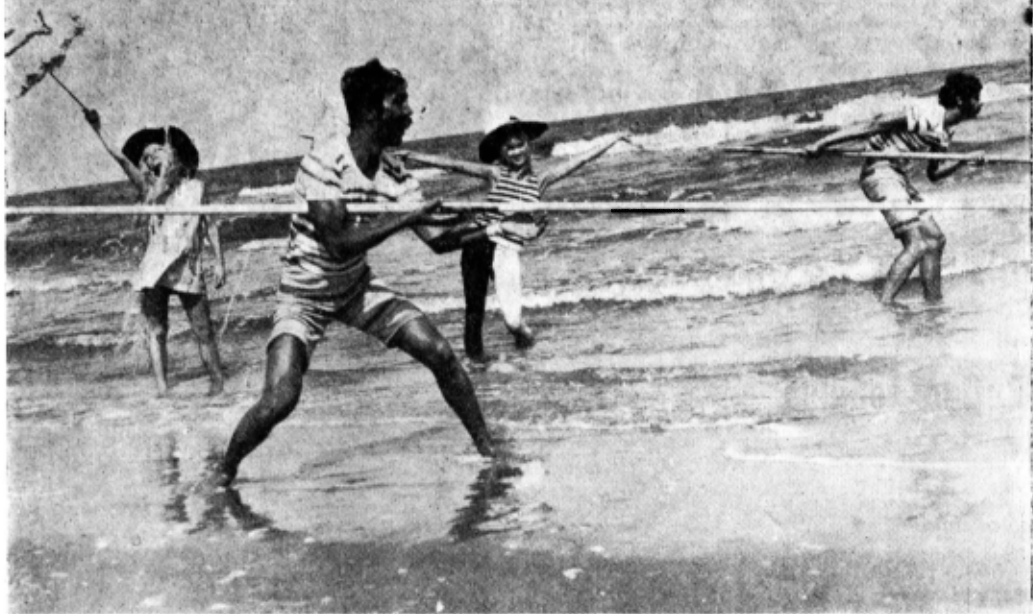
Marea, decor natural pentru o secvență din „Nu sînt turnul Eiffel” de Ecaterina Oproiu

Mușatinilor , încît nu aș putea să mă restrîng la cîteva fraze ocazionale în cadrul unui interviu.