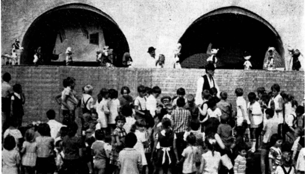
„Ulciorul lui Vasilache“ de Al. Popovici, în interpretarea Teatrului de păpuși din Sibiu. Regia : Zoe Anghel-Stanca. Scenografia : Febus Ștefănescu