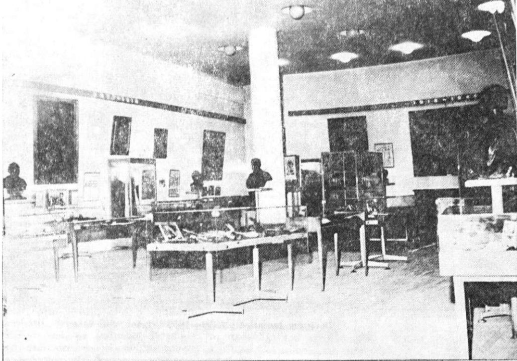
Sala clasicilor actoriei românești

George Vraca: „Va veni o vreme când ți se va recunoaște din plin ceea ce tu ai făcut pentru teatrul românesc”*