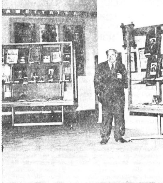
În așteptarea vizitatorilor...