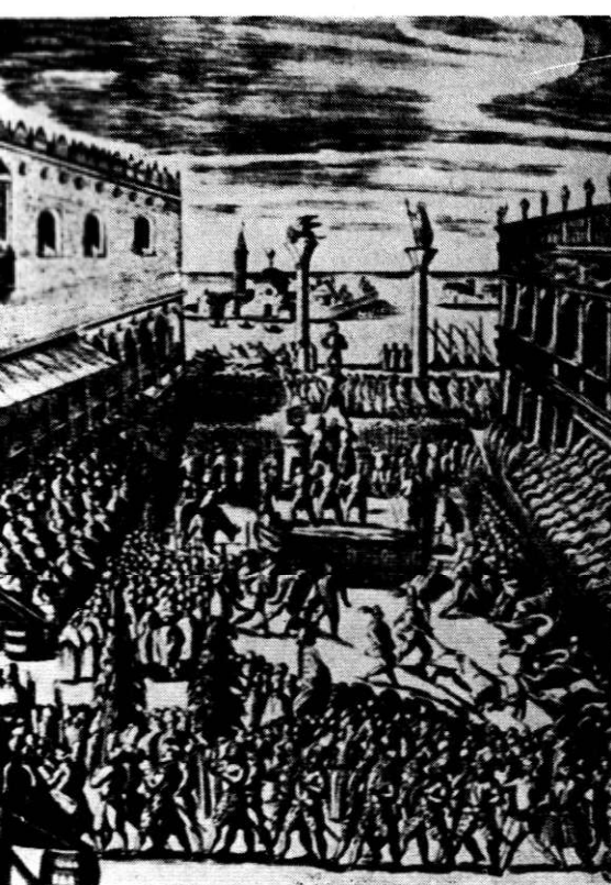
Teatru în aer liber în timpul Renașterii: spectacolul popular în Piazzetta Veneției

— Trăim într-o perioadă când viața noastră spirituală se hrănește mai puțin cu texte și mai mult cu imagini — spune inginerul. Pe stradă sau acasă, omul contemporan este înconjurat — sau „bombardat”, cum spunea esteticiana Geraldine Pelles — de o avalanșă de imagini: semafoare, firme și reclame luminoase, vitrine colorate, filme, televiziune etc. Și poate nu fără temeii, considera René Huyghe, în lucrarea Les puissances de l'image , că definiția de „civilizație a cărții” dată timpurilor moderne ar trebui înlocuită cu aceea, mai corespunzătoare, de „civilizație a imaginii”. Prin ce mijloace teatrul, considerat a fi și el un sistem de imagini, izbuteste să-l smulgă pe „homo videns” din inerția pe care o provoacă un asemenea asalt asupra privirii, diminuind treptat dispoziția reflexivă?