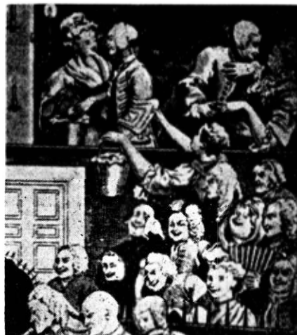
Hogarth: O sală de teatru londonez în secolul al 18-lea

În această privință, teatrul românesc își poate dovedi pe deplin vitalitatea nu printr-o sporire cantitativă a pieselor prezentate, nu printr-o fluctuație permanentă a repertoriilor și nici prin asimilarea ultra-rapidă a unor lucrări de succes din străinătate; numai promovarea curajoasă a unui repertoriu original, autohton, o încurajare atentă a dra-