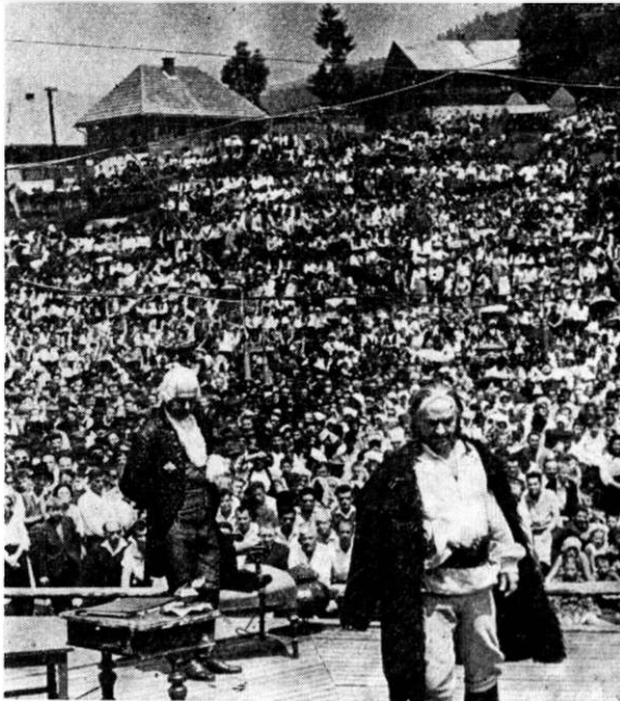
La Albac, în Apusenii. „Procesul Horia” de Alexandru Voitin, prezentat în aer liber, a reunit mii de spectatori.

— Le urmăresc în majoritate, atît pe cele preluate de la alte teatre, cît și pe cele în montare proprie. În ceea ce privește nevoia de a revedea un actor și pe scenă, după ce l-am văzut pe micul ecran, răspunsul e greu de dat, deoarece am sentimentul că cîștigînd numai unul, aș putea nedreptăți pe