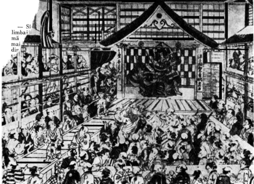
Public înfierbîntat, la un spectacol japonez Kabuki (Stampă de epocă a pictorului Kiyohiro — 1708—1776)

— Între o piesă dinamică, de acțiune și una de gravă meditație, pe care ați alege-o pentru o seară liberă?