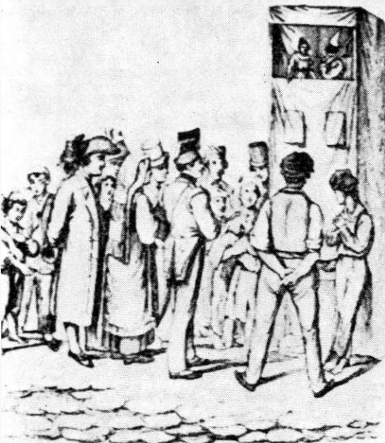
Napolitana Pulcinella și spectatorii ei în secolul XIX