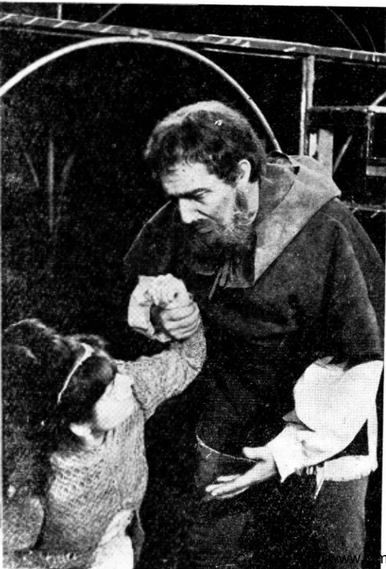
Oradea: „Michelangelo“ de Alexandru Kirițescu