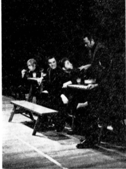
Moment din „L'Opéra d'Aran” — înbinare a operetei de sfîrșit de veac cu muzica ușoară franceză de azi

un teatru, care să-i servească exclusiv propriile interese financiare și politice, „Directorul” are un aliat prețios în credinciosul lui prieten Fred, pictor și scenograf.