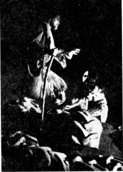
Teatrul „Matei Millo” — Timișoara : „Oedip salvat” de Radu Stanca. Fără ostentație, o montare expresivă