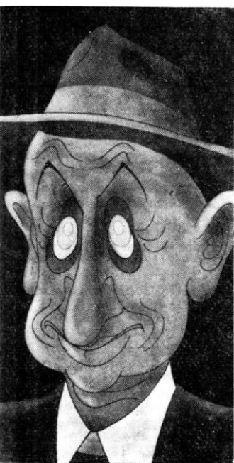
văzuți de Ross