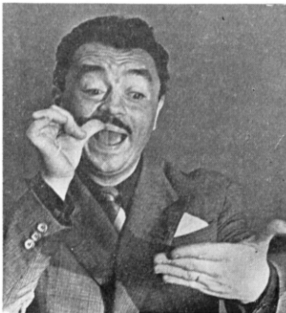
Roluri fără cuvinte într-o pantomimă la TV.