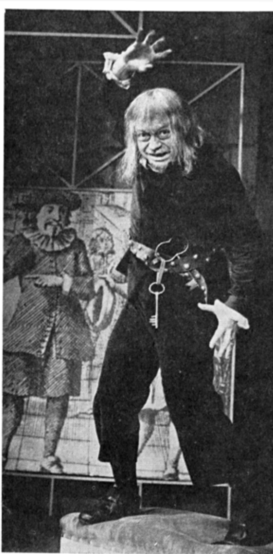
O mască, un caracter : Harpagon

— Mai puțin greu decât să treci de la Mosca la copii! Nu este, nu trebuie să fie, nici o diferență între calitatea creației actorului în teatrul pentru adulți și cel pentru copii. Mai sînt mulți care cred că bietul copil este o ființă inferioară care „înghite” orice. După cum sînt mulți autori care „mimează” copilăria după propriile amintiri, devenite desuete și anacronice. Copilul nu este o ființă inferioară, ci o făptură umană care nu a avut timp să se perfecționeze. A nu-i acorda respectul cuvenit înseamnă a-l schilodi sufletește.