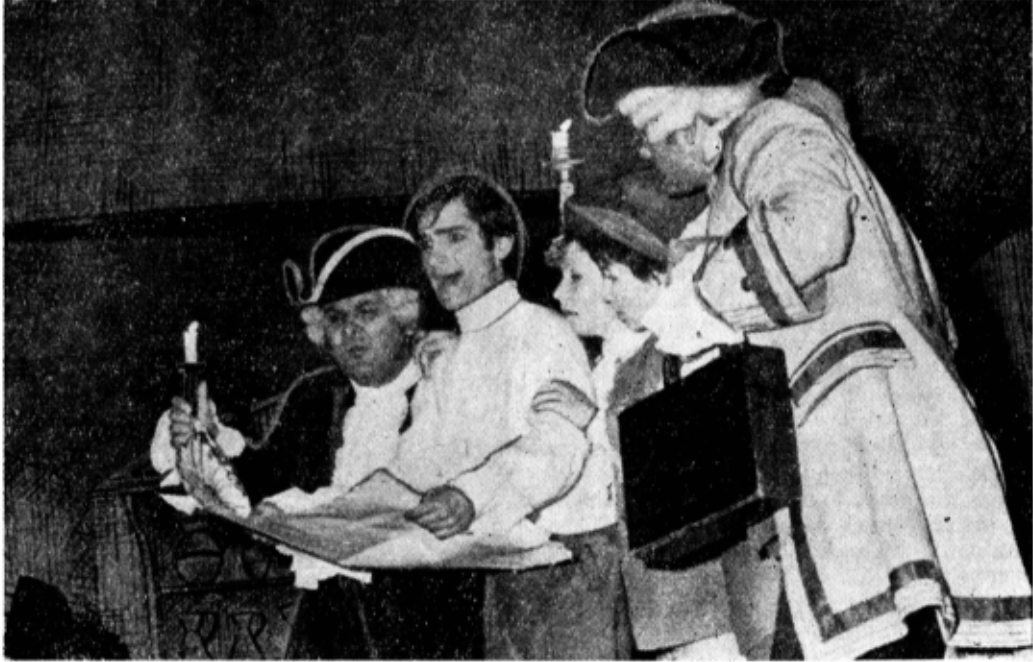
Scenă din spectacol