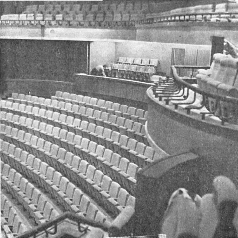
Tot sala mare... unghiuri de vizi- bilitate judicio- ase

Ne pregătim să pătrundem în clădirea teatrului, parcurgând spațiile largi ce preced intrarea, sau, lăsând mașina la parcajul subteran, pe locurile rezervate dumneavoastră ca spectator, și urcând cu lifturile "direct" în teatru.