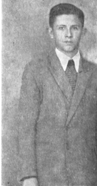
La 14 ani..

terpreta rolurile principale, cărăm scaunele din grădina publică. (De pe atunci, deci, dorream să avem public...) — Cum v-ați întâlnit cu teatrul profesionist?