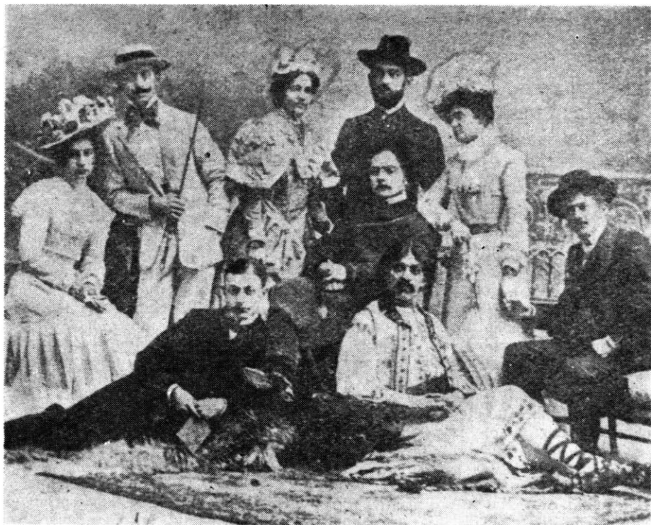
„Diletanții“ din Lugoj în piesa „Idilă la țară“, jucată în anul 1900

comoară neseacă de bogății etnografice, pe care noi încă nu o cunoaștem deplin, cuprinde niște tablouri feerice, cari încintă ochii și înduioșează inima.