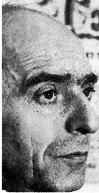
Ionescu-Gion: „In lume Paradisul nu-i uitat“

ritura îi era prea uzată, i-am copiat textul cu un singur deget la mașină, în câteva nopți, i-am transcris desenele și l-am legat într-o ediție a mea de lux. „E nevoie de rituri!“.