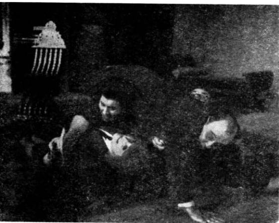
Teatrul Evreiesc de Stat. Scenă din „Transfuzia“ de Jak Konfino www.cimec.ro

Printre norii de praf de pușcă, în mijlocul exploziilor asurzitoare de bombe adevărate și al urletelor la fel de adevărate ale soldaților-cobai, un emisar al guvernului regal, lipsit de autoritate, pus repede, și într-un chip ridicol, în imposibilitate de a-și desfășura o proiectată anchetă, încearcă, zadarnic, pentru câteva clipe, să aducă în discuție necesitatea respectării normelor de drept, fluturînd fraze de-a gata și invocînd nobile (dar foarte vagi) idealuri de justiție. Se descifrează ușor aci ironia cu care autorul tratează ineficiența discuțiilor în vînt, a apelurilor la rațiune atunci cînd acestea sînt adresate unui tiran deloc dispus la penitență. Conflictul — un aparent dialog între surzi — se rezolvă prematur printr-o lovitură de teatru: călăul e suprimat de una din probabilele sale victime. Alte câteva surprize dramatice încheie piesa, fără a găsi dezlegare problemelor aduse în dezbatere.