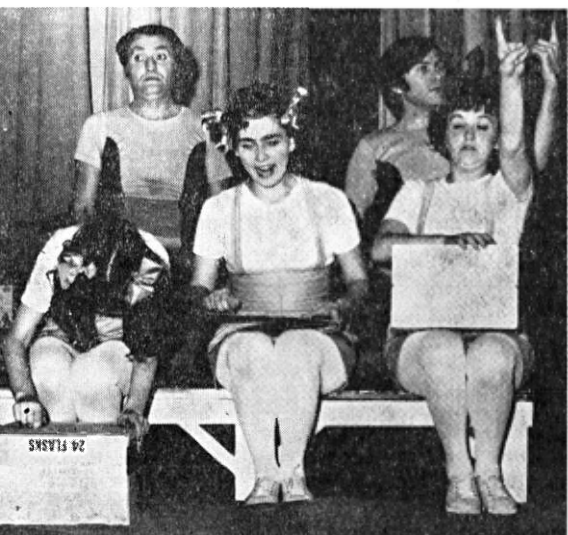
„Joc la soare”, o invitație la fantezie.