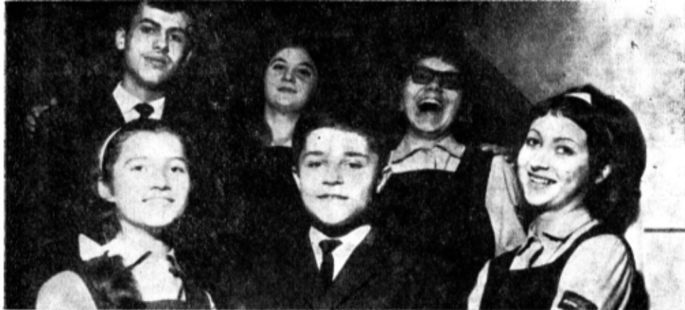
Cițiva din elevii liceului „Gh. Lazăr” care au răspuns întrebărilor reporterilor noștri