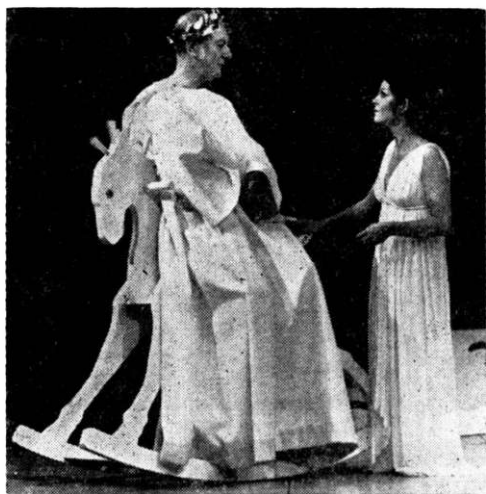
John Gielgud și Anna Calder-Marshall în „Cezar și Cleopatra”