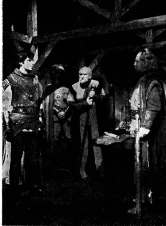
„Mușatinii“, serial după Delavrancea. Decor: Cornel Ionescu; costume: Georgeta Itigan

Dreapta, sus: „Iașii în carnaval“ de Vasile Alecsandri. Costume: Rodica Hanagic.