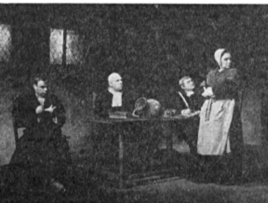
„Ulciorul sfărmat” de Kleist

zian de Brecht, Contemporanii de Armin Stolper, Zilele fericite ale unui om nefericit de Alexei Arbuzov.