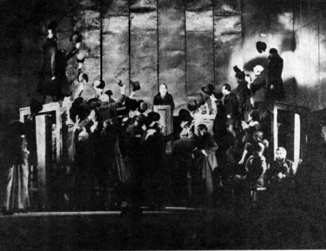
Scenă din „Moartea lui Danton” de Georg Büchner, în regia lui Liviu Ciulei (Teatrul „Lucia Sturdza Bulandra”)

tive în funcție de cerințele vii ale creației. Dezvoltarea continuă, atât artistică, a colectivelor, cât și organizatoric-administrativă a condițiilor de muncă. De aceea — dezvoltarea și profesionalizarea nu numai artistică, dar și organizatorică și tehnică a teatrului românesc. Organizarea și tehnica sînt domenii în care, față de alte instituții de cultură și alte domenii de muncă, în general, teatrul nostru a rămas mult în urmă, printre altele și pentru că în această direcție i s-a acordat mult mai puțin sprijin.