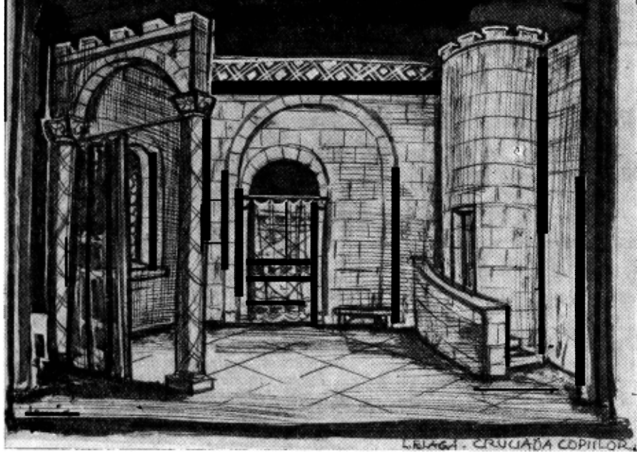
Schiță de decor de T. Demian pentru piesa „Cruciada copiilor” de Lucian Blaga, în vechea montare a teatrului maghiar clujean

Bán. În această operă, prin personajul Tiborc, poporul maghiar își rostește pe scenă întreaga durere, vorbește despre împilarea și exploatarea sa, despre speranțele sale. Pentru realizarea scenică a acestui personaj și-a adus contribuția cel mai de seamă actor al teatrului care împlinește 175 de ani de existență, realizând cea mai importantă creație a vieții sale: Szentgyörgy István. Institutul de artă teatrală din Tîrgu-Mureș poartă astăzi numele lui.