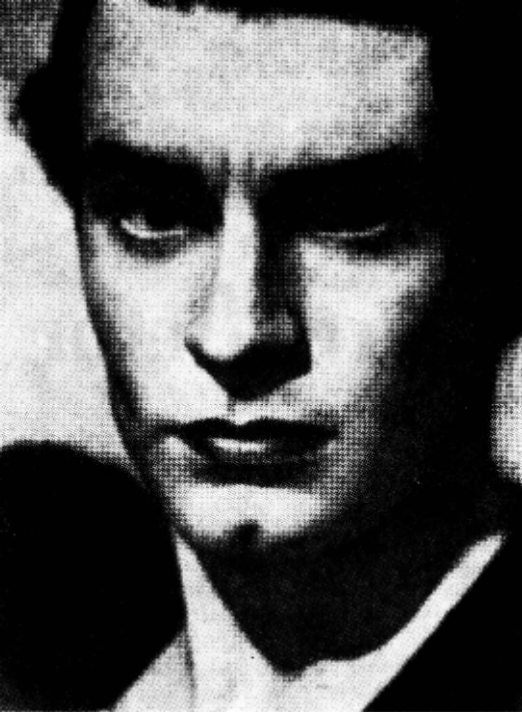
Laurence Olivier (n. 1907)