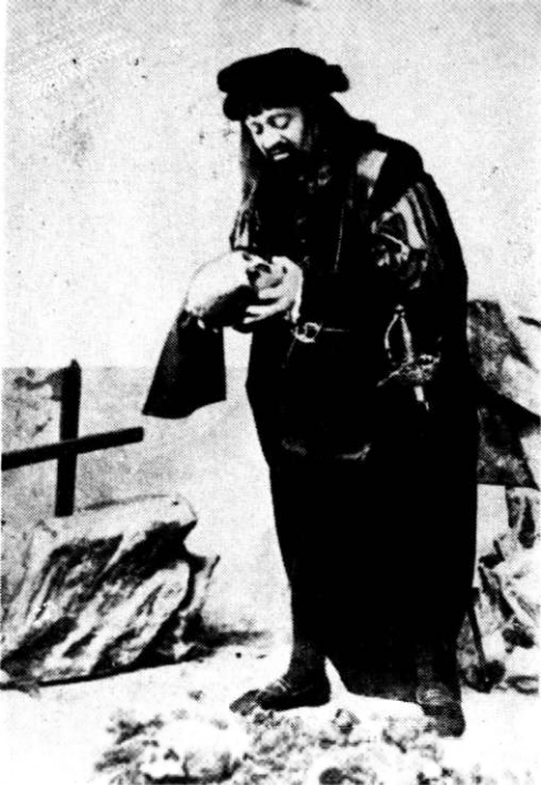
C. I. Nottara (1859—1935)