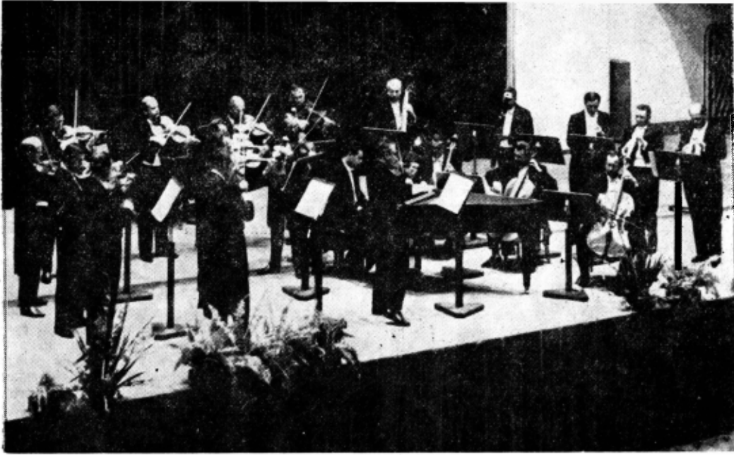
Bach-Orchester des Gewandhauses, din Leipzig