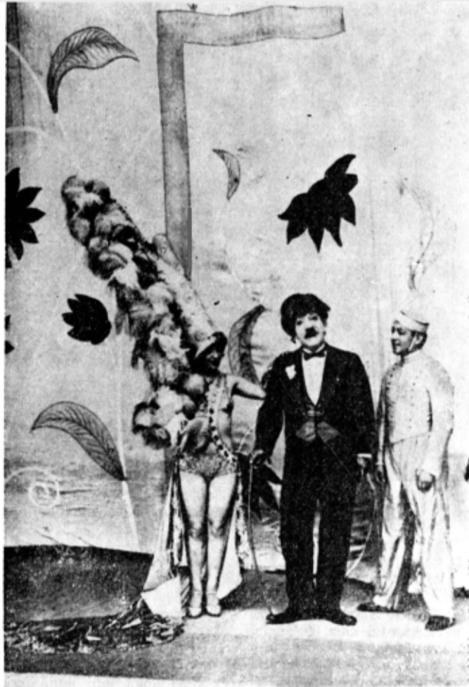
Chaplin : un rival sau un rol ?