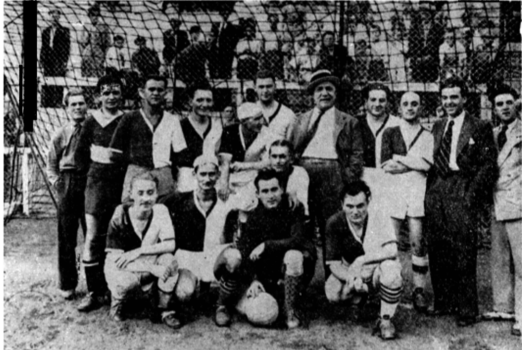
Într-o postură inedită: antrenor al echipei de fotbal „Cărăbuș“

Aicea, firește, eu fiind învățător, m-am remarcat repede și comandantul meu, colonelul Hirieu — fost ministru de război — m-a luat în nume de bine, așa că vezi, chestia dracului, eu urmam școala de caporali și eram profesor la sergenți și subofițeri, care se pregăteau pentru școala de la Bistrița.