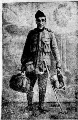
TÂNASE se întoarce de la Rasboi și Da-i înainte Da-i înainte

S.B. Pentru a nu se da luc la tubulsoara la casa, trebuie si a rugat sa se pregateasca letele din vreoze, care astfel e posibil sa nu se mai gaseasca de la