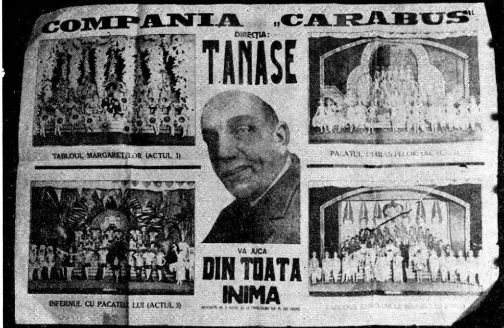
Un afiș al companiei „Cărăbuș”. Autorul spectacolului: dramaturgul A. de Herz

Dar văzînd că n-am încotro, m-am întors la regiment la Hîrjeu și i-am spus: