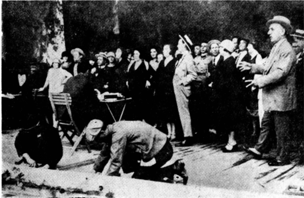
Repetiție la „Cărăbuș“

stimează, Mitică). N-am timp nici să-mi contemplan nasul. Ceea ce fac anul acesta la Teatrul Eforiei nu s-a mai văzut în România. Am prevăzut totul, de la inimitabila senzație a jocului actorilor până la marea și luminoasă montare. Am cheltuit aproape două milioane pentru această revistă. Publicul vrea mereu mai bun, mai frumos. Îl satisfac. Căci el e cel mai bun factor de reclamă. Afîșe nu mai citește nimeni. Că e ger și fuge de rupe pămîntul. Dar fiecare, după ce a văzut spectacolul, se duce acasă și zice :