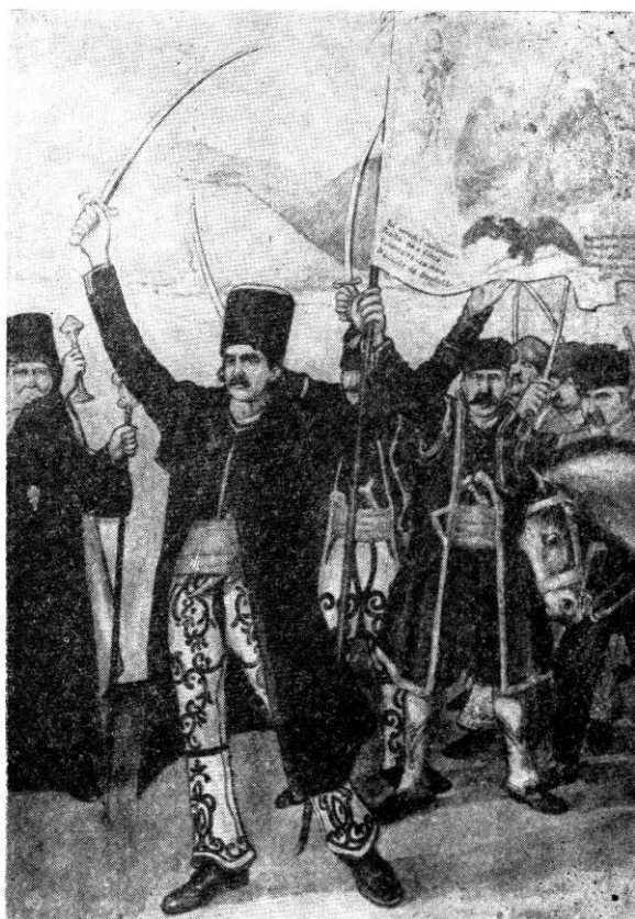
Tudor Vladimirescu părăsind Cotroceni la 15/27 mai 1821. În stînga episcopul Ilarion al Argeșului, în dreapta Hagi Prodan (Lito-grafie după un desen de Ary Munn).

CAPODISTRIA : Nici o unitate militară rusă n-a trecut pe vreunul din teritoriile supuse suzeranității Porții. Iar ambasadorul nostru la Constantinopol, contele Stroganov, i-a declarat oficial Prințului Osman că nu-și poate asuma responsabilitatea nebuniilor lui Ipsilante. Dacă imperiul otoman e confruntat cu greutăți insurmontabile, ca : războiul civil cu pașa din Ianina, revolta Muntenegrului, tulburările din Creta și din Bosnia, mișcarea de independență a sîrbilor și bulgarilor, ca să ajungem, în sfîrșit, la insurrecția din Țările Române, asta se cheamă, juridic vorbind, că incapacitatea sa de a asigura ordinea internă a imperiului, primejdivește echilibrul puterilor europene și justifică dreptul de intervenție al altei mari puteri.