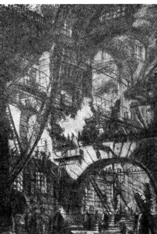
Temnițe. Litografie de Piranesi

să cădem la învoială. Ne-am născut noi pe alte meleaguri, eu în Olimp, și tu la poalele Carpaților, dar văd că vorba și gândul ne sînt aidoma fiindcă și unul și altul avem același țel: elefteria — libertatea.