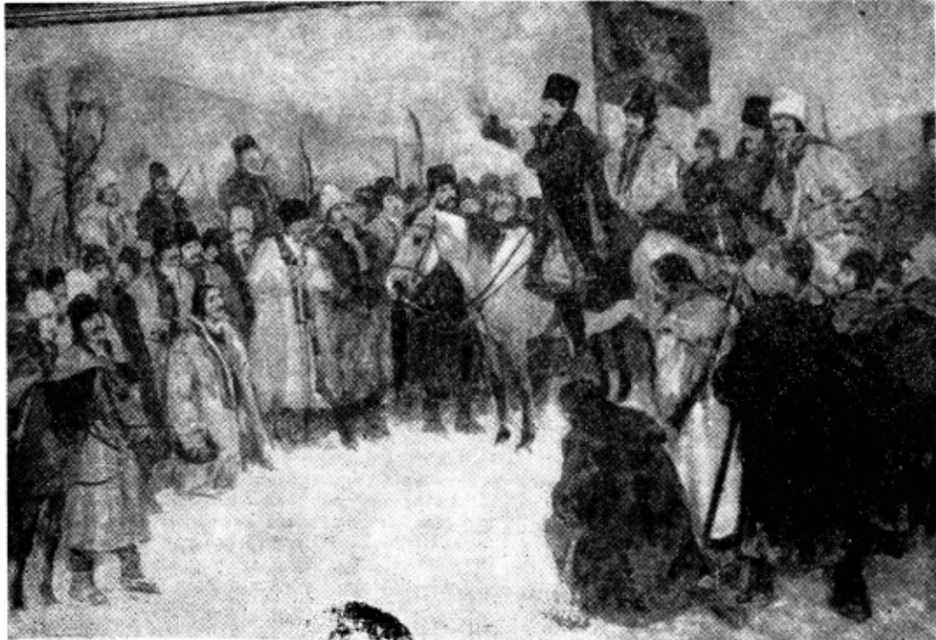
Tudor Vladimirescu citind proclamația de la Padeș — Tismana