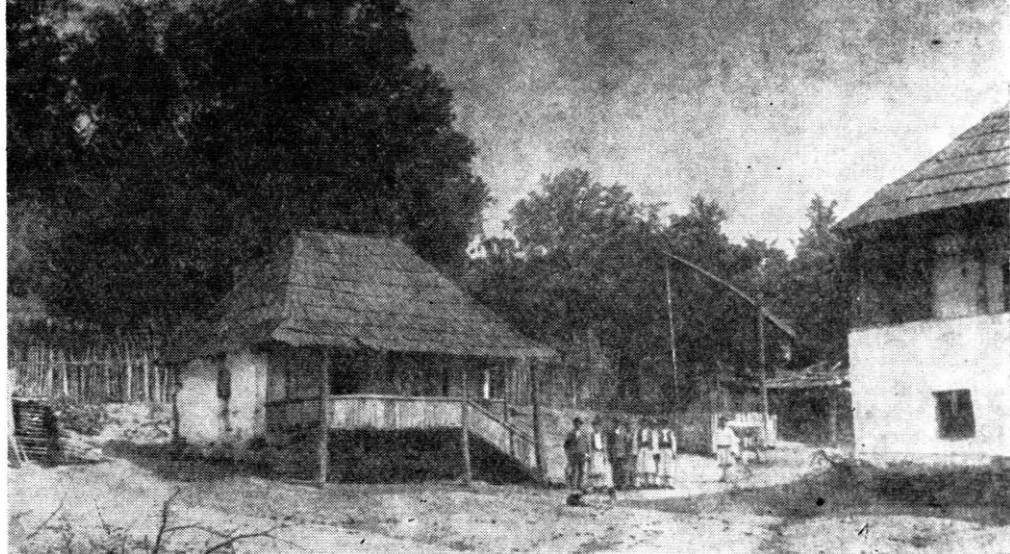
Casa lui Tudor Vladimirescu din satul Vladimiri, județul Gorj.