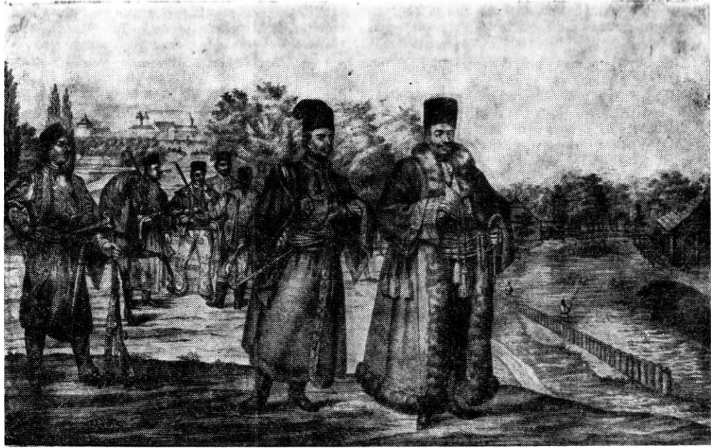
Tudor Vladimirescu cu pandurii săi în fața mănăstirii Cotroceni (litografie din secolul XIX).