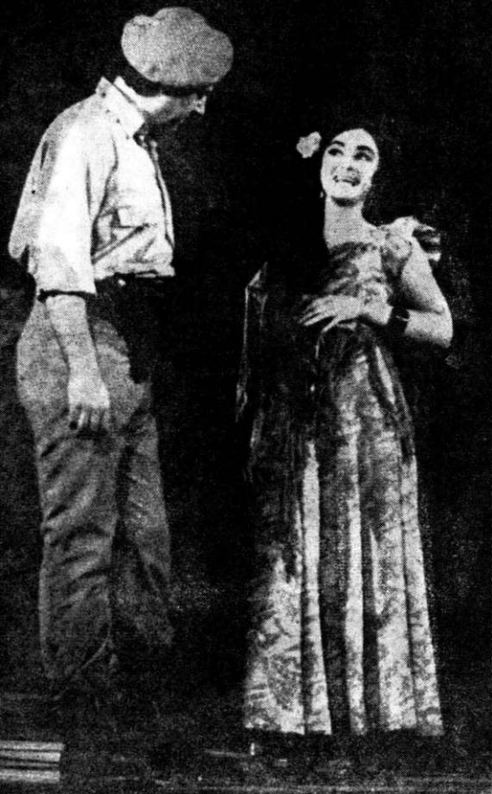
„Odihna la Iarko-Iris”, în interpreta- rea Teatrului din Iambol

lozica înaripată: „Mai mult pentru popor, mai aproape de popor” a ridicat la o treaptă superioară legăturile creatorilor din dramaturgie și teatru cu oamenii muncii.