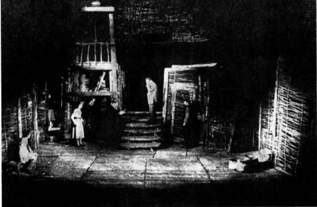
„Visătorii” de Orlin Vasiliev, la Teatrul Dramatic din Plovdiv

acest Kiril, „parcă un comunist modern care, înainte cu șase veacuri, biciuiește contemporaneitatea și răscoală pe cei oprimați și nedreptățiți”.