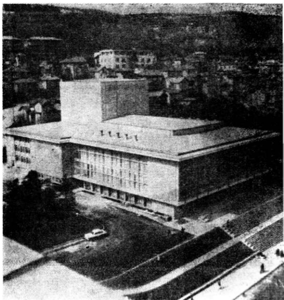
Noua clădire a teatrului din orașul Tirnovo

Capriși de o puternică feroare patriotică, autorii bulgari au creat un vibrant curent de