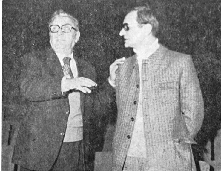
Aurel Baranga și Radu Beligan