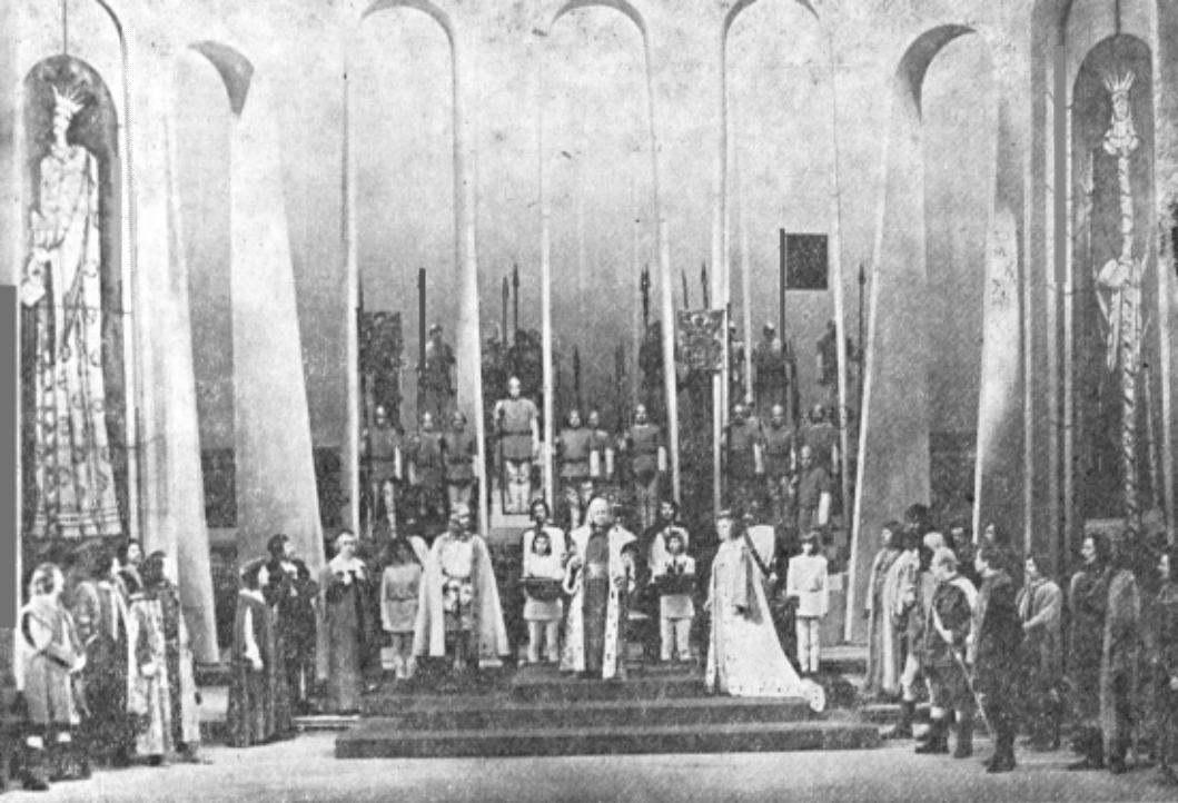
...și aceeași scenă la premiera din 20 decembrie 1973

...Azi, după aproape șapte decenii, marele erou al lui Delavrancea, Ștefan Vodă, re-apare în straie noi, sârbătorești, ca să cinstescă deschiderea noului lăcaș al primei noastre scene.