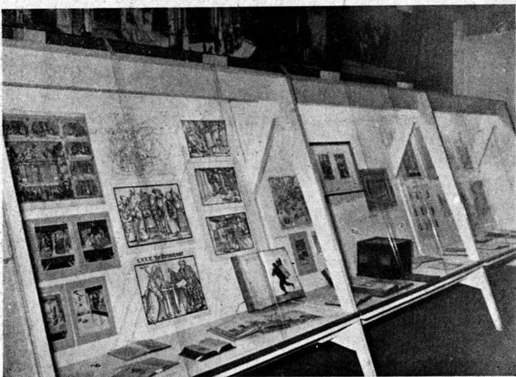
O vitrină din sala teatrului Renașterii (Expoziția teatrului european 1955)