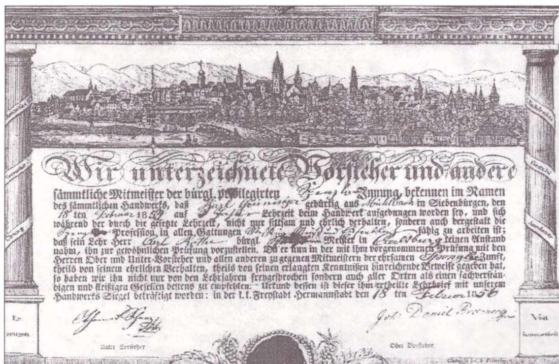
Fig.1 Diplomă de meseriaș tinichigiu (18 februarie 1856).