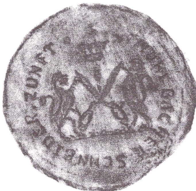
Fig.6 Sigiliul breslei fierarilor și lăcătușilor din Sebeș (1874).