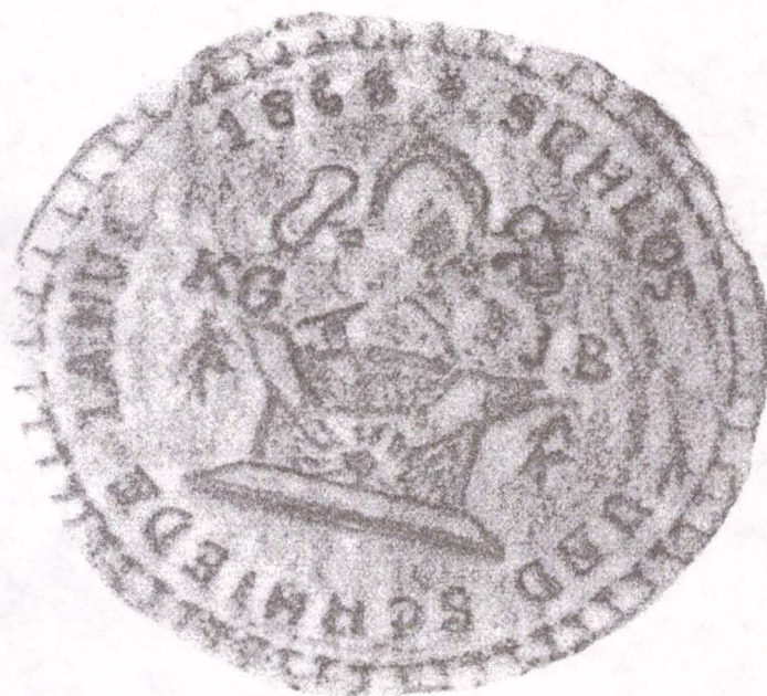
Fig.8 Sigiliul breslei fierarilor și lăcătușilor.