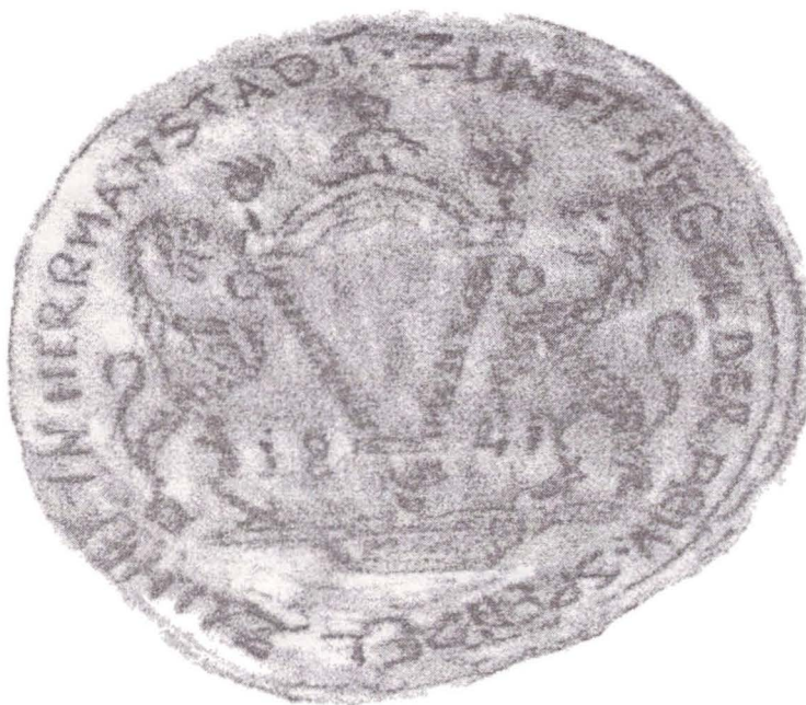
Fig.2 Sigiliul breslei meseriașilor tinichigii, Sibiu (1856).