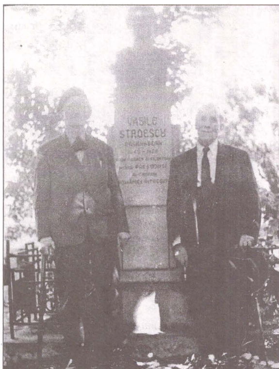
Foto 2. Mormântul lui Vasile Stroescu din București: în dreapta, fruntașul politic basarabean, Pantelimon Halippa și în stânga, Gheorghe Cristescu (Plăpumaru), primul secretar al Partidului Comunist Român