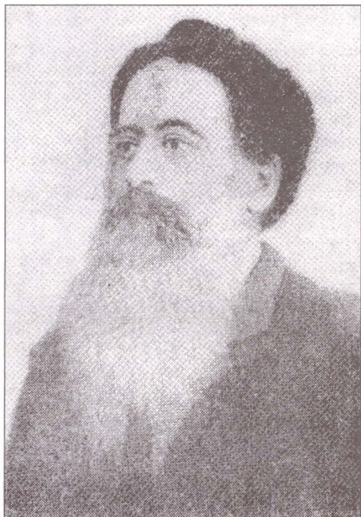
Foto 1. Boierul Vasile Stroescu