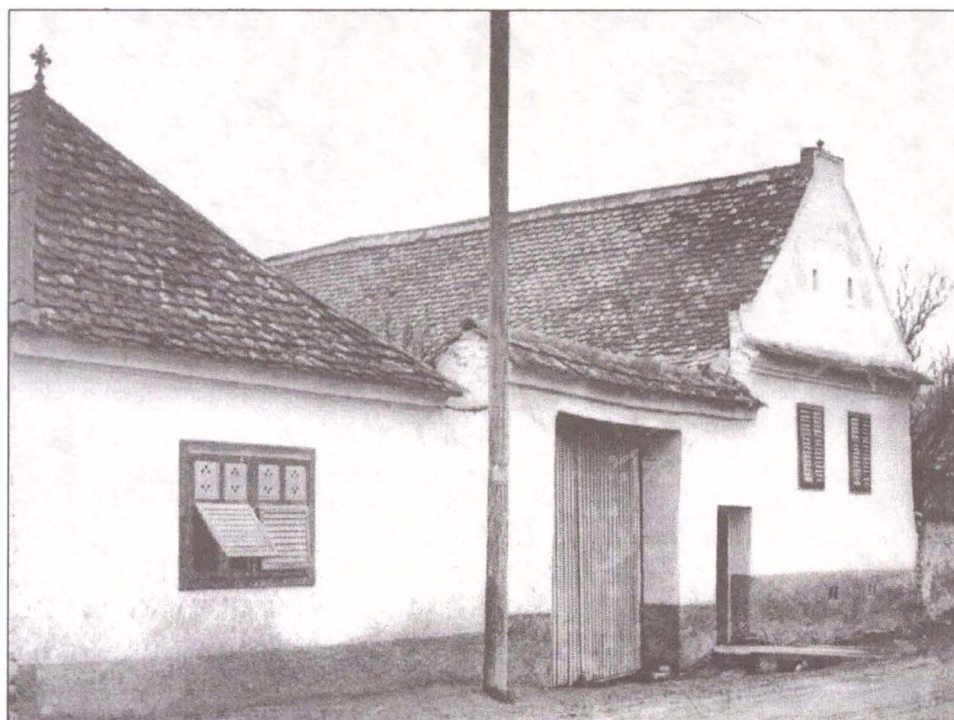
Fig.3 - Casa natală a pictorului Sava Henția