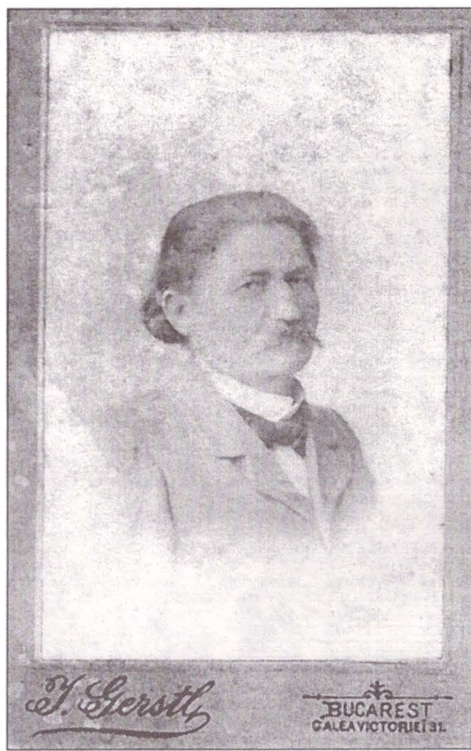
Fig. 2. - Fotografii ale artistului