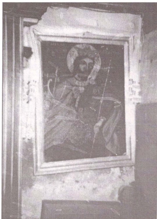
Icoană pe tablă cu Marele Mucenic Mercurie , sf. sec. XIX, ale cărei moaște sunt cusute în Sfântul Altar al bisericii din sat Galeș, jud. Sibiu