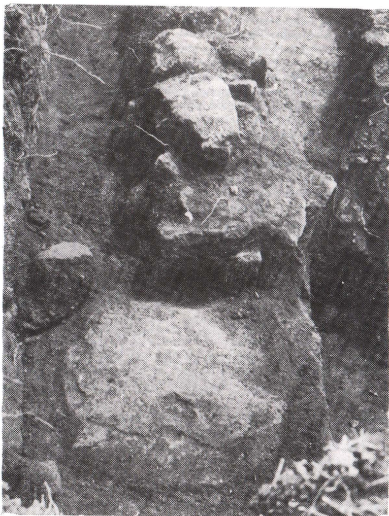
Fig. 2. Vatră de foc (sec. IX–X) descoperită în spărtura zidului unei clădiri din complexul agricol roman de la Deva.

sînt astfel create și uzurparea devine inevitabilă. Procesul este însă de lungă durată, căci în plin feudalism se pomenesc în Transilvania „sortile” de pămînt ce le acordau țăranilor din satele obștești, după nevoie, cnezii și juzii. Stăpînierea devălmașe a pămîntului, folosirea în comun a pădurilor, apelor, pășunilor, responsabilitatea colectivă în materie fiscală și penală, toate acestea sînt rămășițe ale vechii organizări obștești.