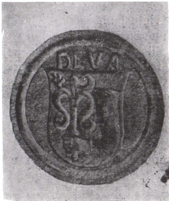
Fig. 4. Primul sigiliu al localității Deva (1618).

În a doua jumătate a sec. XIV, cetatea Devei, împreună cu domeniul ce depindea de ea se afla în posesiunea voievodului Transilvaniei. De aici, voievodul conducea, prin supușii săi, întregul comitat al Hunedoarei 42 ). Cetatea Deva rămîne în această situație pînă la mijlocul sec. XV, cînd intră, prin donație, în posesia lui Iancu de Hunedoara și a urmașilor săi (fig. 4).