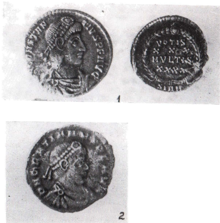
Fig. 1. Monede imperiale din secolul IV, descoperite la Micia (Vețel) 1. Constantius II ; 2. Grațianus (reversul complet deteriorat).

aceștia, societatea locală a cunoscut o dezvoltare continuă și ascendentă, un impuls acestei evoluții imprimindu-i, în sec. VII, luarea de contact cu obștea, slavă al cărei nivel de dezvoltare economică și social-politică era asemănător cu al populației autohtone, cu care intra în legătură.