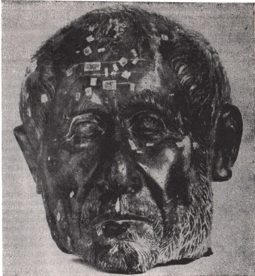
FIG. 1. PORTRETUL ÎMPĂRATULUI TRAIANUS DECIUS, DIN FAȚĂ

Piesa a fost executată prin turnat și prezintă la suprafață obișnuita patină de culoare verde închis. Capul are înălțimea de 25 de cm, cu grosimea pereților de 5—8 mm. Ținând cont de aceste dimensiuni, rezultă că monumentul era aproximativ de mărime naturală.