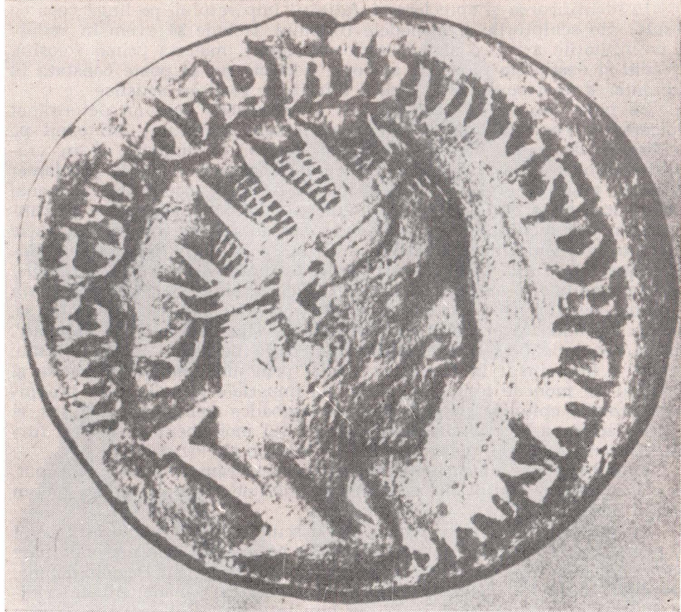
FIG. 3. EFIGIA LUI TRAIANUS DECIUS PE O MONEDĂ ROMANĂ

tratate cu grijă, cu dalta, după operația de turnare — nu este redat în același fel pe toată suprafața capului: ovalul calotei craniene este sumar lucrat, fapt care nu se poate explica decît prin aceea că această parte a capului, fiind mascată de un obiect oarecare (coroană cu lauri sau de raze), nu se vedea. Toate aceste amănunte și atribute ne determină să recunoaștem în opera de care ne ocupăm figura unui împărat.