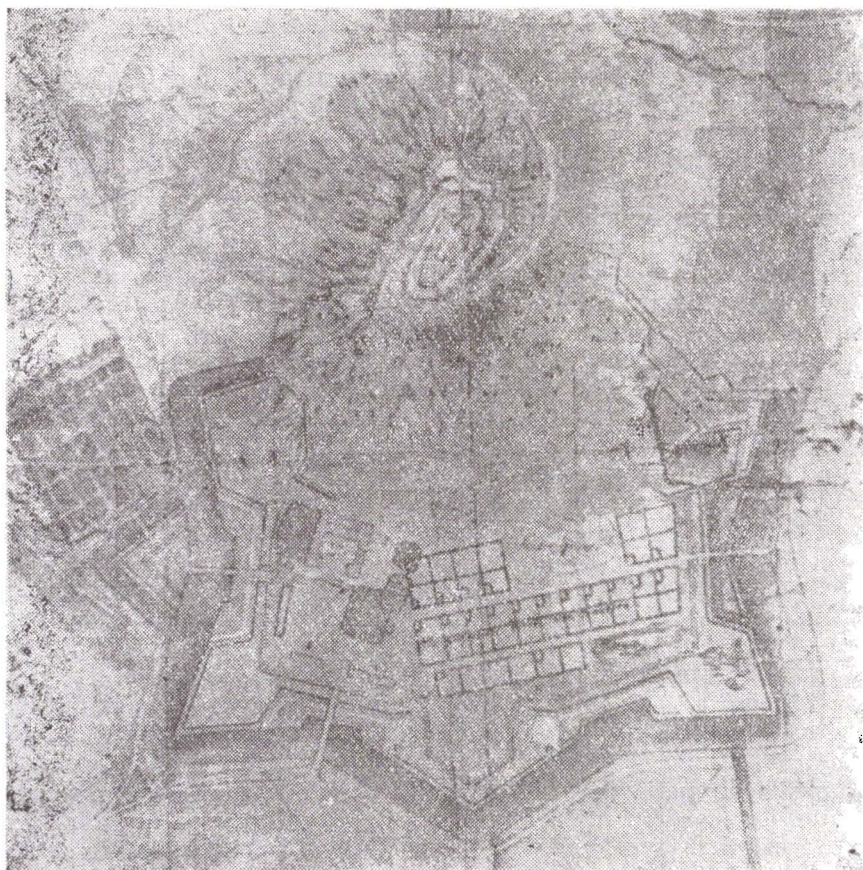
Fig. 2. — Planul orizontal al cetății Deva (sec. XVII)

Steinvillie, cînd cetatea va fi renovată și suplimentar întărită, adăugindu-i-se noi bastioane și fortificații 14 . La poalele cetății, acesta a construit vestitul „șanț”, o fortificație din pămînt și lemn, cu trăsături geometrice variate și simetrice, prevăzută cu șanțuri pline cu apă, asemănătoare tipului de fortificații în formă de stea 15 (fig. 2).