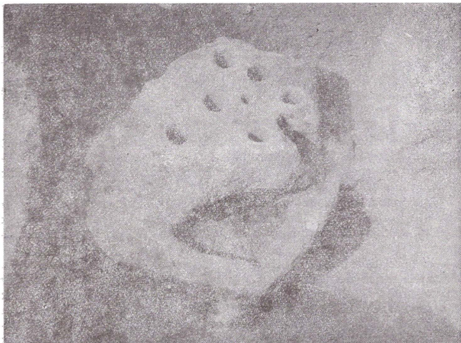
Fig. 1. Deva, cartierul Bejan — Cuptorul dacic pentru ars ceramică.

Pentru cercetarea acestei instalații de ars ceramică a fost deschisă o casetă ( 1,20 \times 0,50 m), pe latura sudică a șanțului 5 .