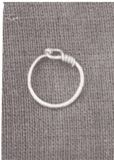
Fig. 1. Sarmizegetusa. Cercei din sîrmă subțire de aur.