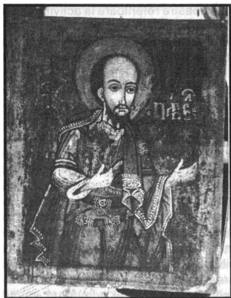
Fig. 1 - Grigorie Ranite (?), Sfântul Apostol Pavel, ½ sec. XVIII, Biserica din Ferendia (Timiș).