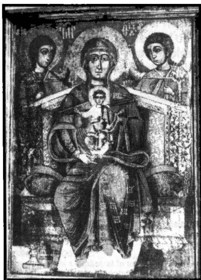
Fig. 4 - Nedelcu Popovici, zugrav, Fecioara Maria cu pruncul pe tron, 1749, Biserica din Călnic.