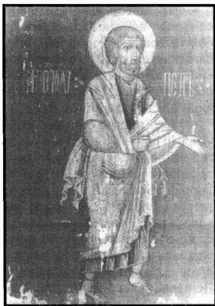
Fig. 2 - Gheorghe Ranite (?), Sfântul Apostol Petru, 1743, Biserica din Otsenița (Timiș).