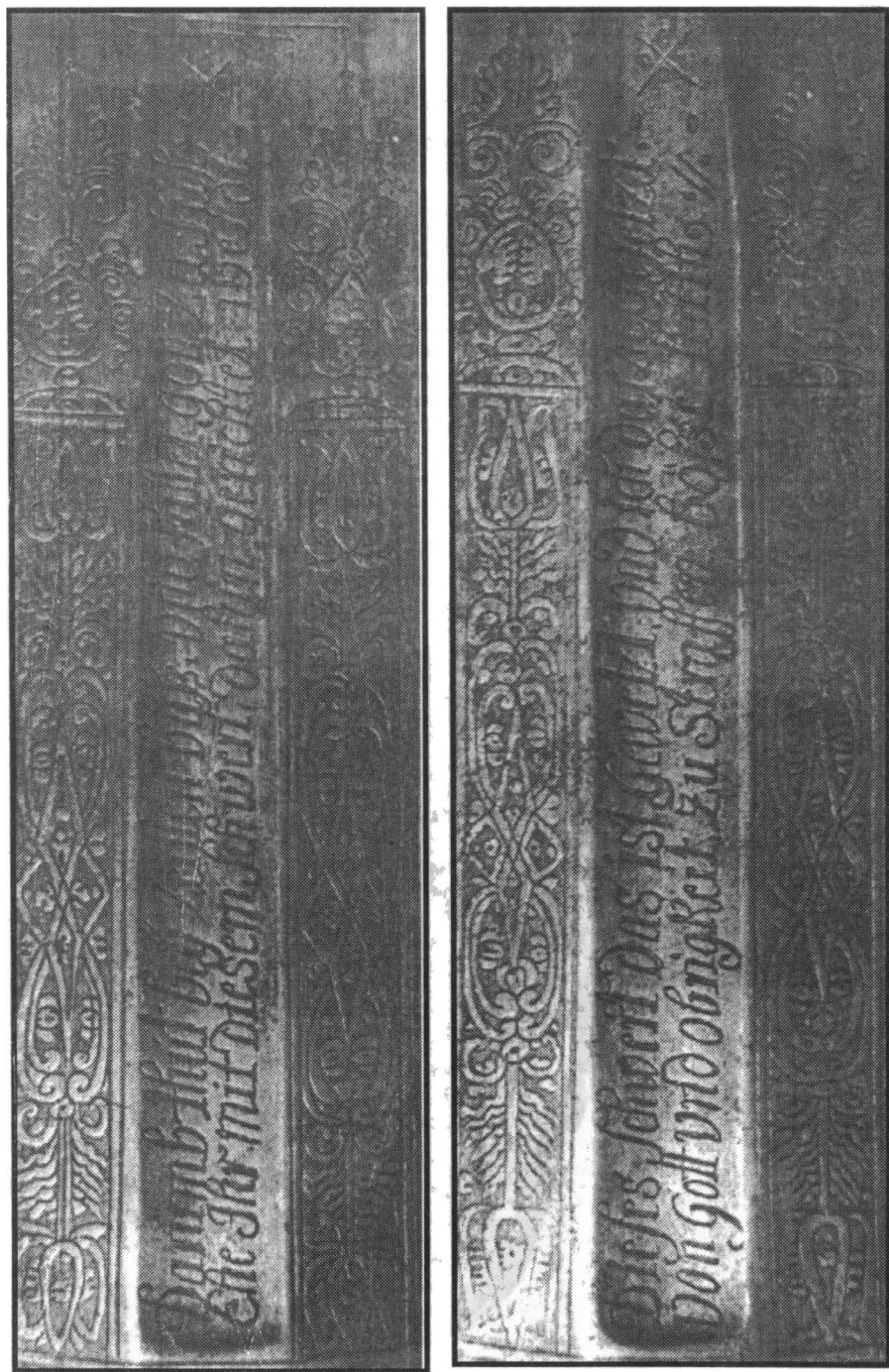
Foto 1 – 2. Aversul și reversul spadei de călău din sec. XVI. Inscriptii