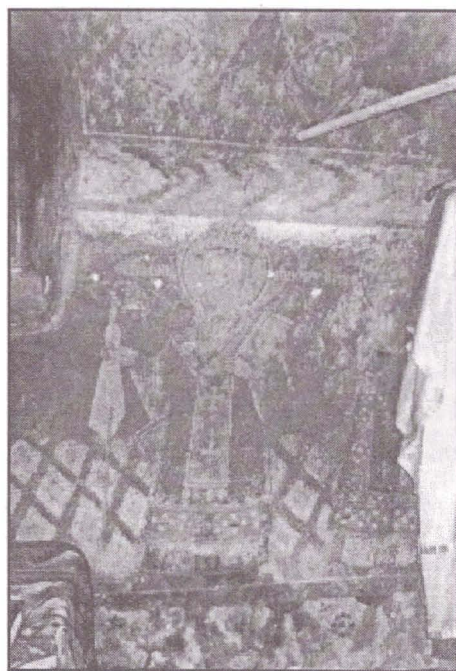
Fig. 2. Altar. (Fragment).