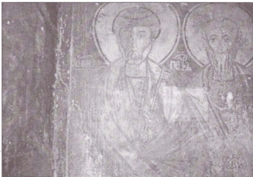
Fig. 1. Sf. Petru și Pavel. (Detaliu).