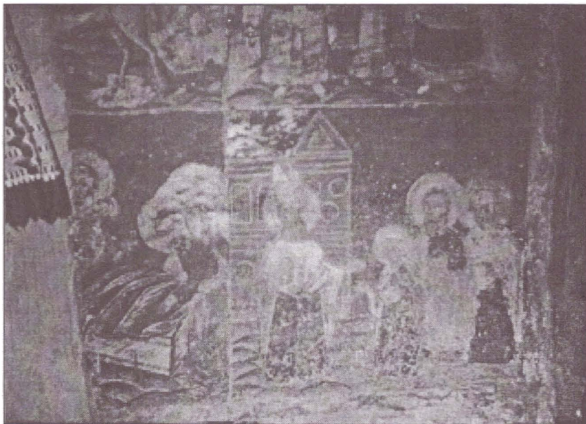
Fig. 4. Tâmpla de zid. (Fragment).