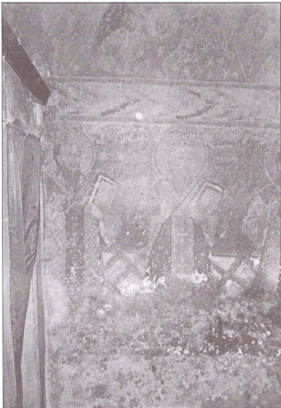
Fig. 3. Altar. (Fragment).