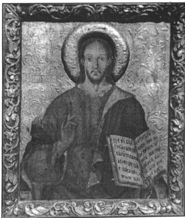
Fig. 4. Icoană împărătească – Iisus Pantocrator – Zugrav Simion Silaghi