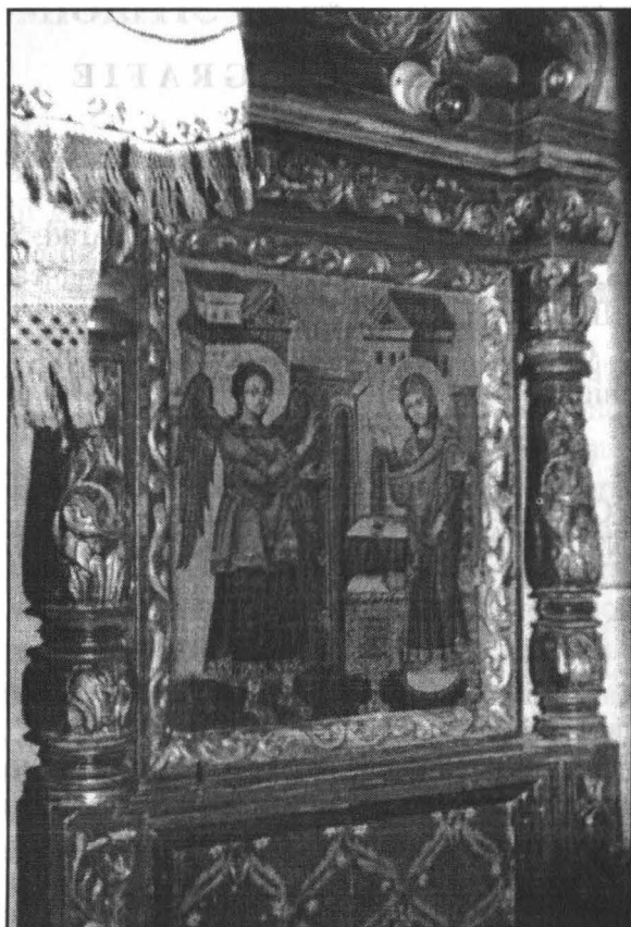
Fig.3. Icoană împărătească – Bunavestire – Zugrav Gh. Iacov