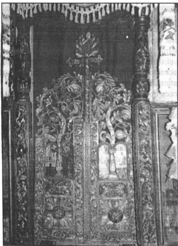
Fig.2. Ușile împărătești (Scena Bunavestire)