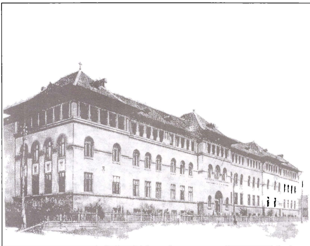
Institutul Recunoștinței din Blaj